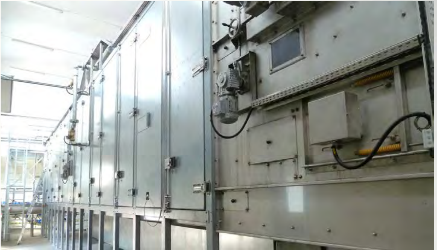
项目地：SeenTechnologie, 波兰 | 型号：PBT 2/2500-14 | 安装年份：2013 干燥物料：市政污泥 | 蒸发量：1.25吨/小时