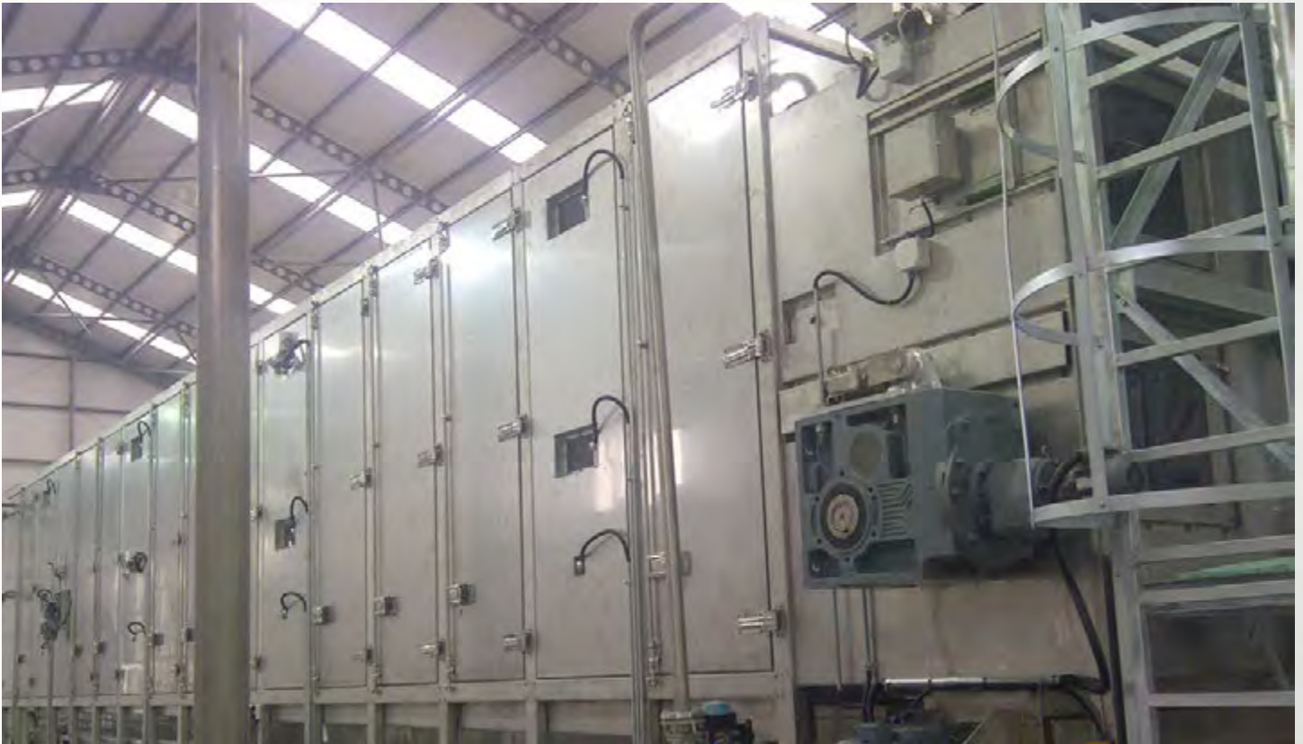
项目地：Corlu Leather, 土耳其 | 型号：2x PBT 2/2500-28 | 安装年份：2014 干燥物料：市政污泥 | 蒸发量：2.9吨/小时