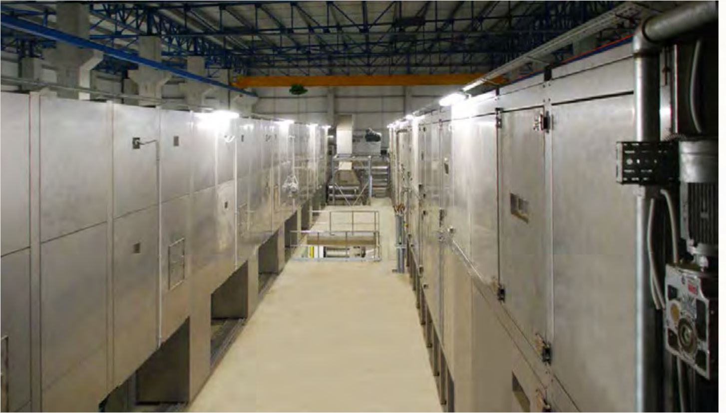
项目地：Municipality of Izmir, 土耳其 | 型号：4x PBT 2/4000-39 | 安装年份：2013 干燥物料：市政污泥 | 蒸发量：25.0吨/小时