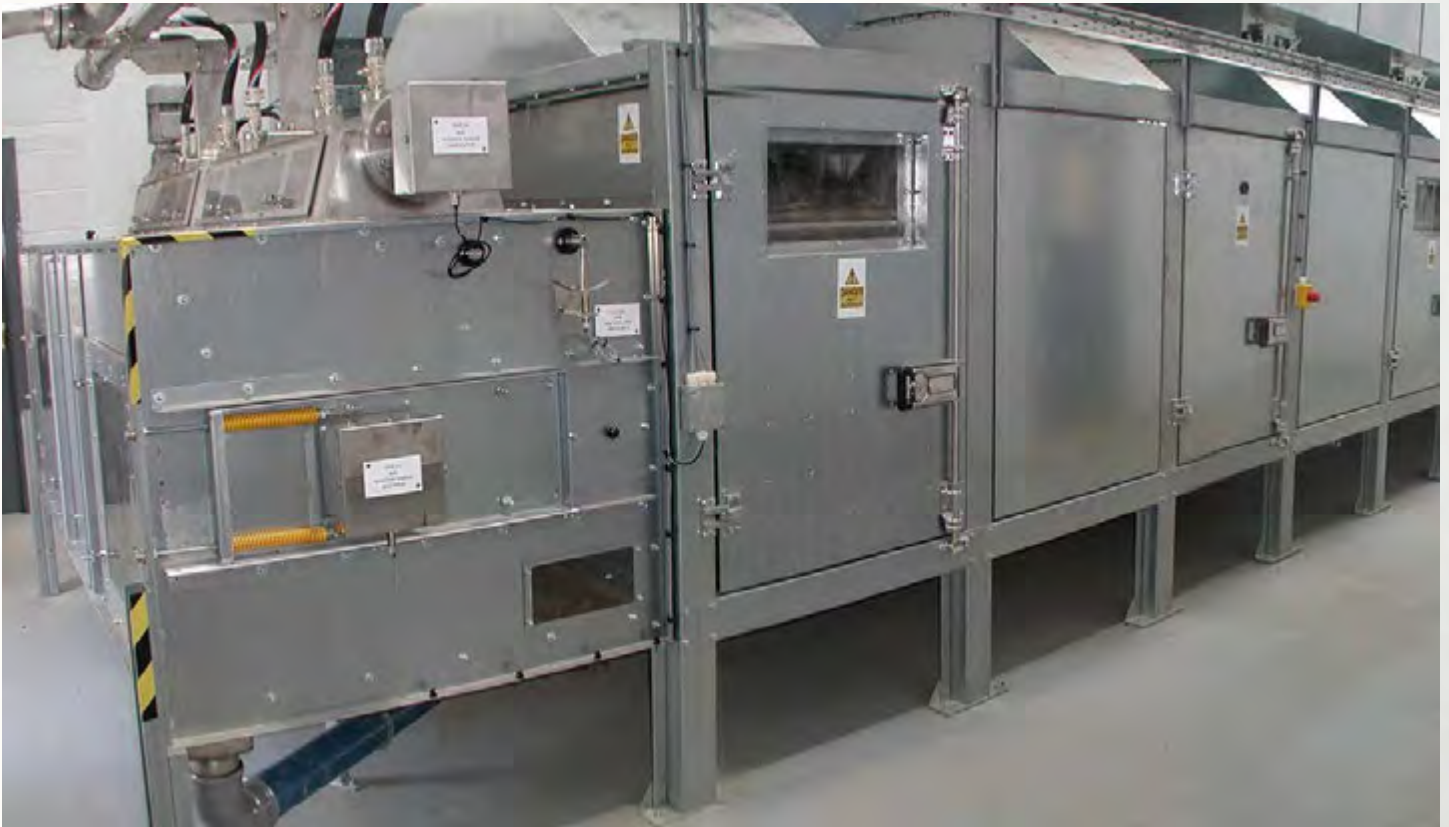
项目地：Euroby, 爱尔兰 | 型号：PBT 2/2500-17 | 安装年份：2009 干燥物料：市政污泥 | 蒸发量：1.0吨/小时