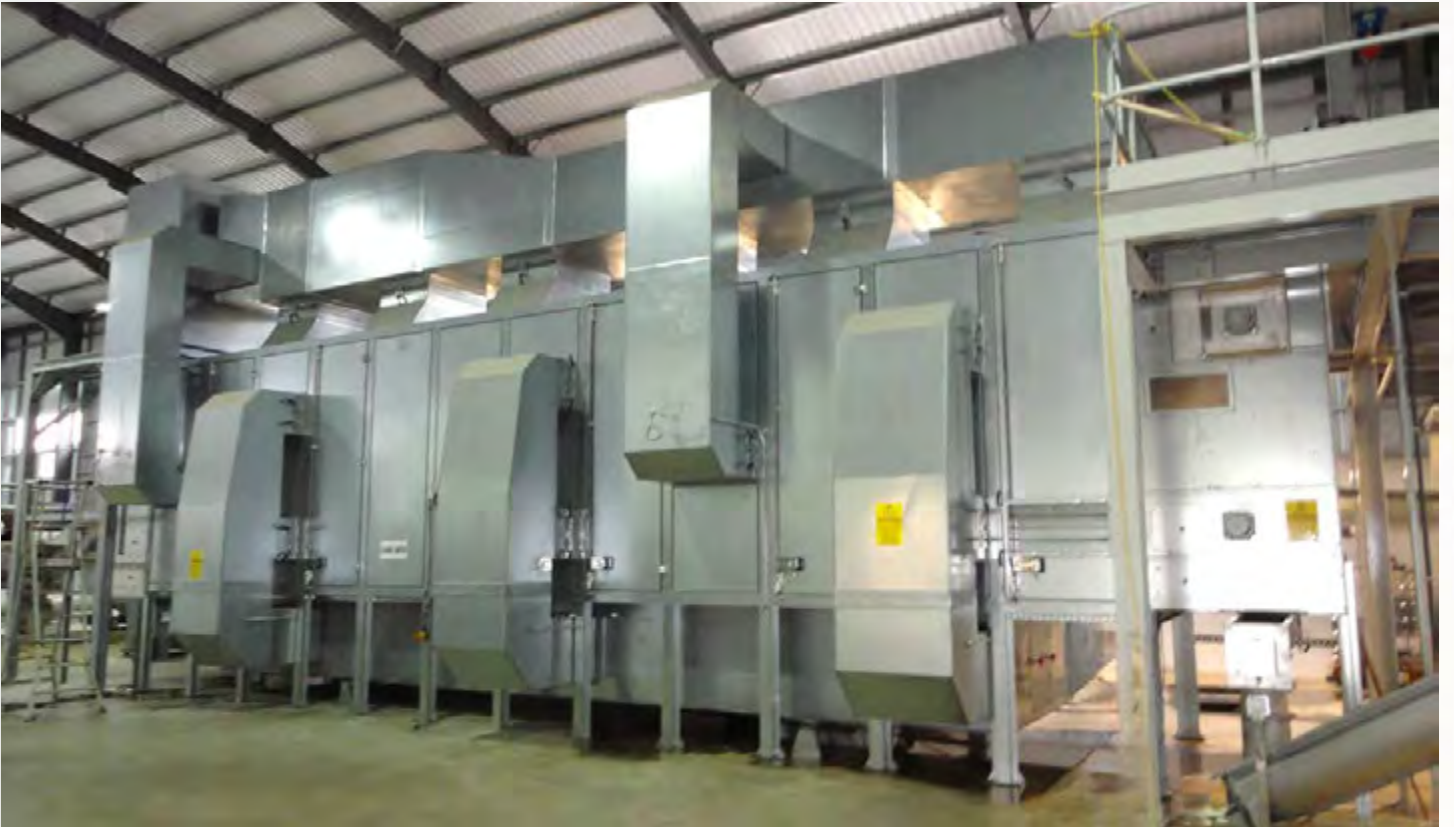
项目地：Electrical & Pump Services Ltd., 爱尔兰 | 型号：PBT 2/2500-12 | 安装年份：2012 干燥物料：公用市政污泥 | 蒸发量：1.25吨/小时