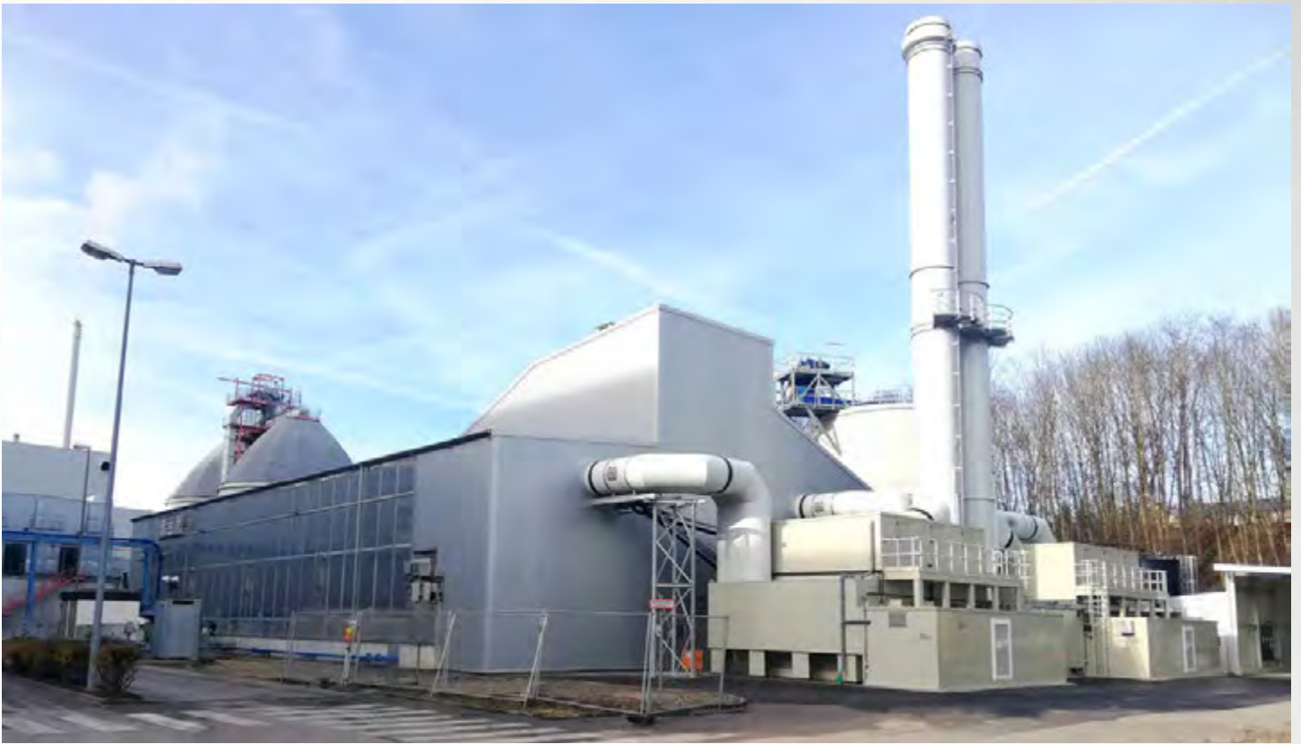
项目地: Sewage sludge drying, 德国 | 型号: 2x BTU 1/6200-36-4/4 | 安装年份: 2020 干燥物料: 市政污泥 | 蒸发量: 12.5吨/小时