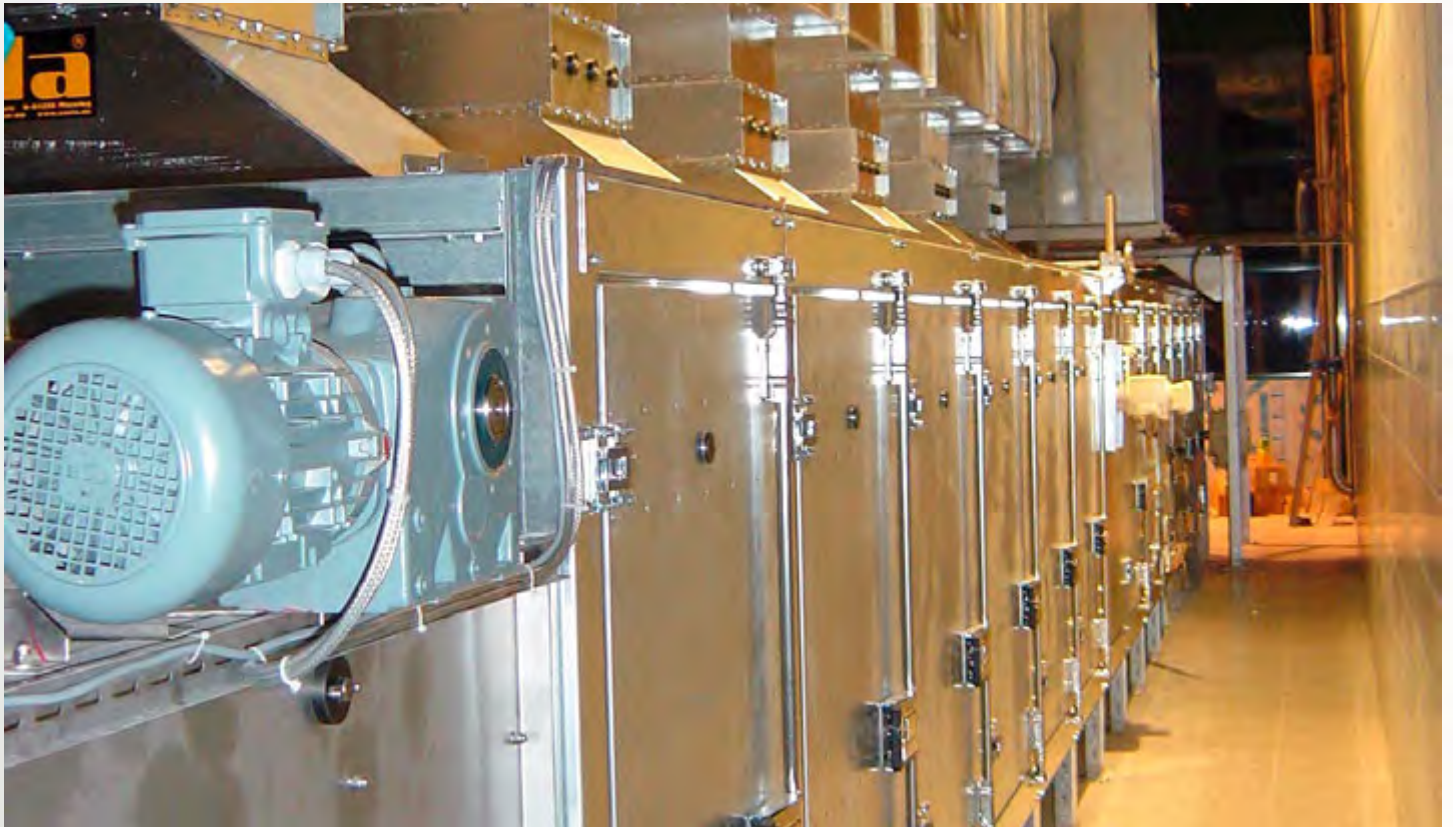
项目地：ARA Sölden, 奥地利 | 型号：PBT 1/2500-13 | 安装年份：2002 干燥物料：市政污泥 | 蒸发量：800公斤/小时