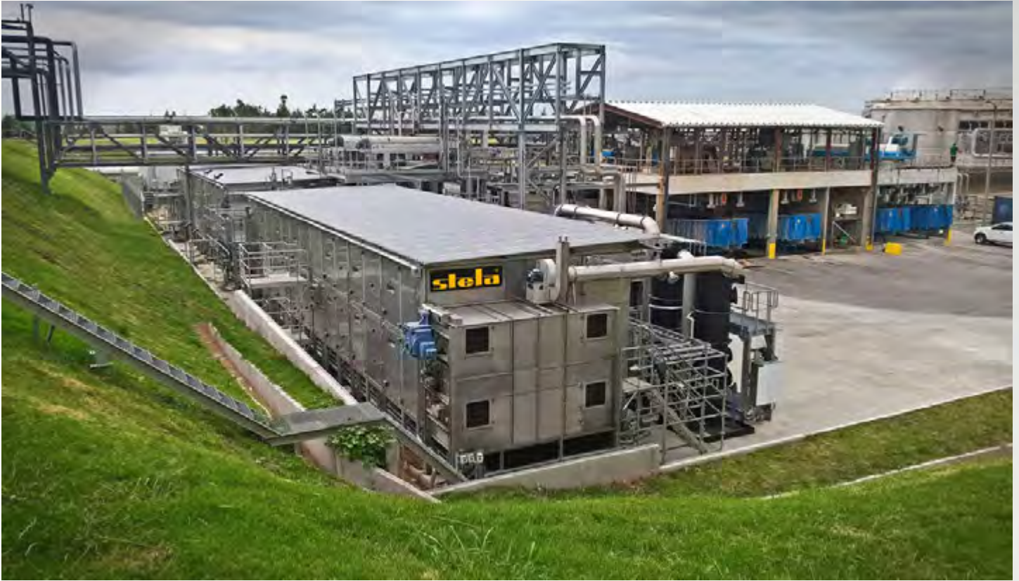
项目地：UPM S.A., 乌拉圭 | 型号：2x PBT 2/4000-21 | 安装年份：2017 干燥物料：生化污泥、磷污泥 | 蒸发量：8.0吨/小时