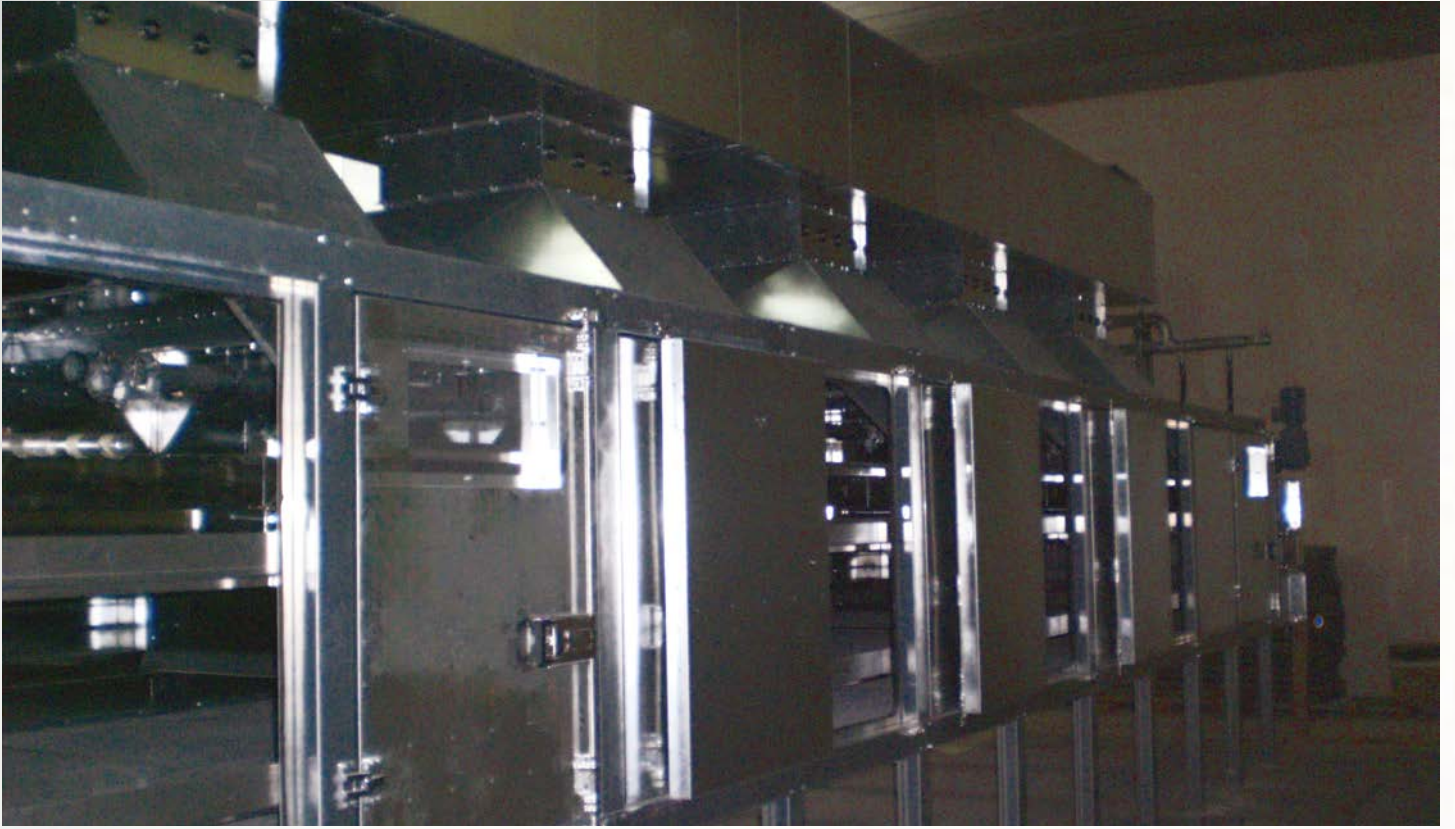
项目地：Stereau, 法国 | 型号：PBT 1/2500-15 | 安装年份：2009 干燥物料：市政污泥 | 蒸发量：900公斤/小时