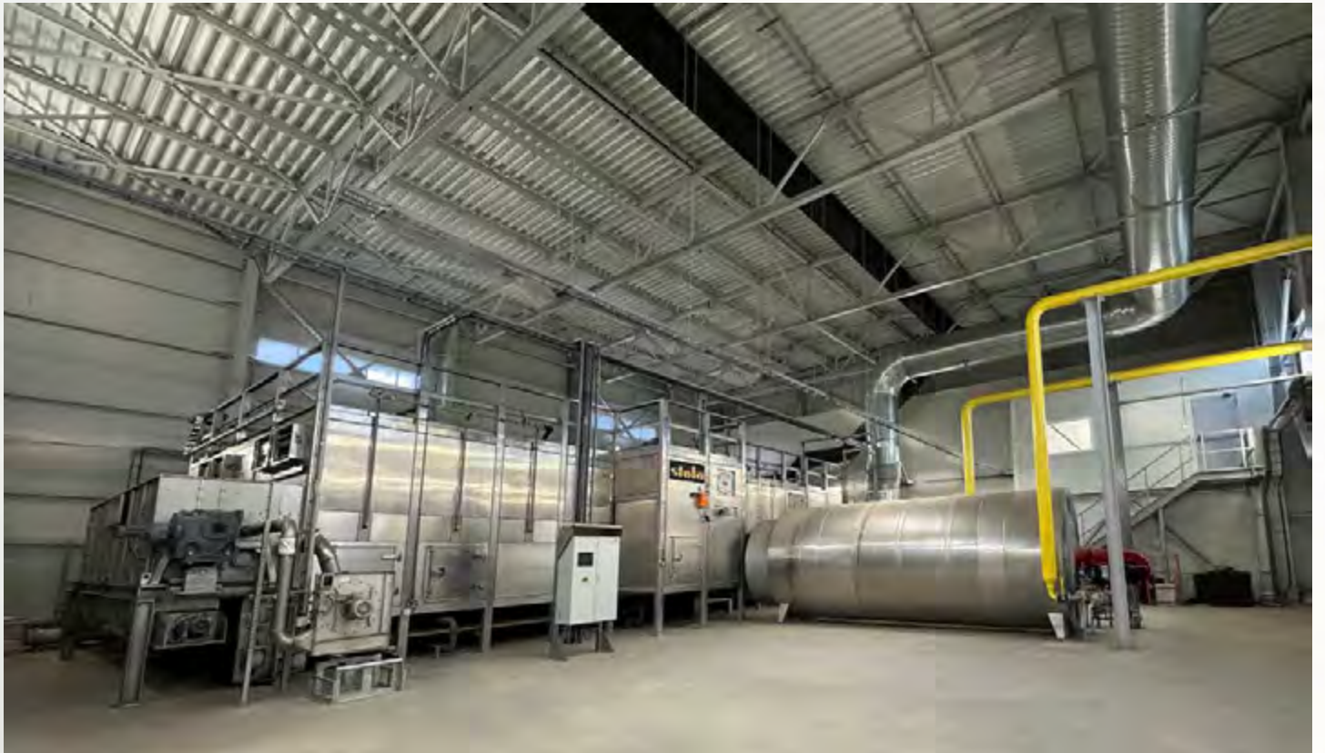
项目地：SC Raja SA, 罗马尼亚 | 型号：BTU 1/6200-18 | 安装年份：2022 干燥物料：市政污泥 | 蒸发量：3.1吨/小时