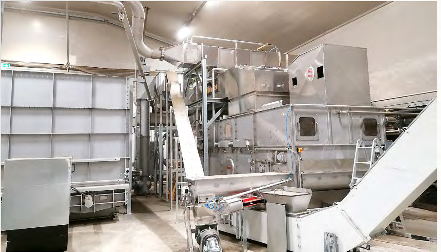
项目地：Ämmässuo 垃圾站, 芬兰 | 型号：BTLU 1/2000-6 | 安装年份：2020 干燥物料：市政污泥 | 蒸发量：360 公斤/小时