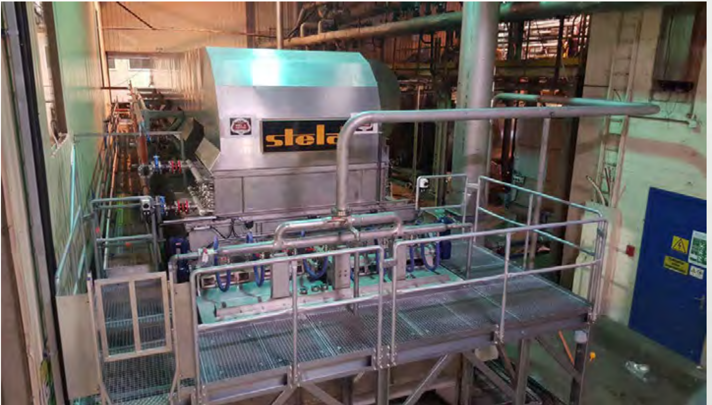
项目地：Ecoson Belgie BVBA, 比利时 | 型号：BTLU 1/3000-18 | 安装年份：2020 干燥物料：脱水污泥 | 蒸发量：707 公斤/小时