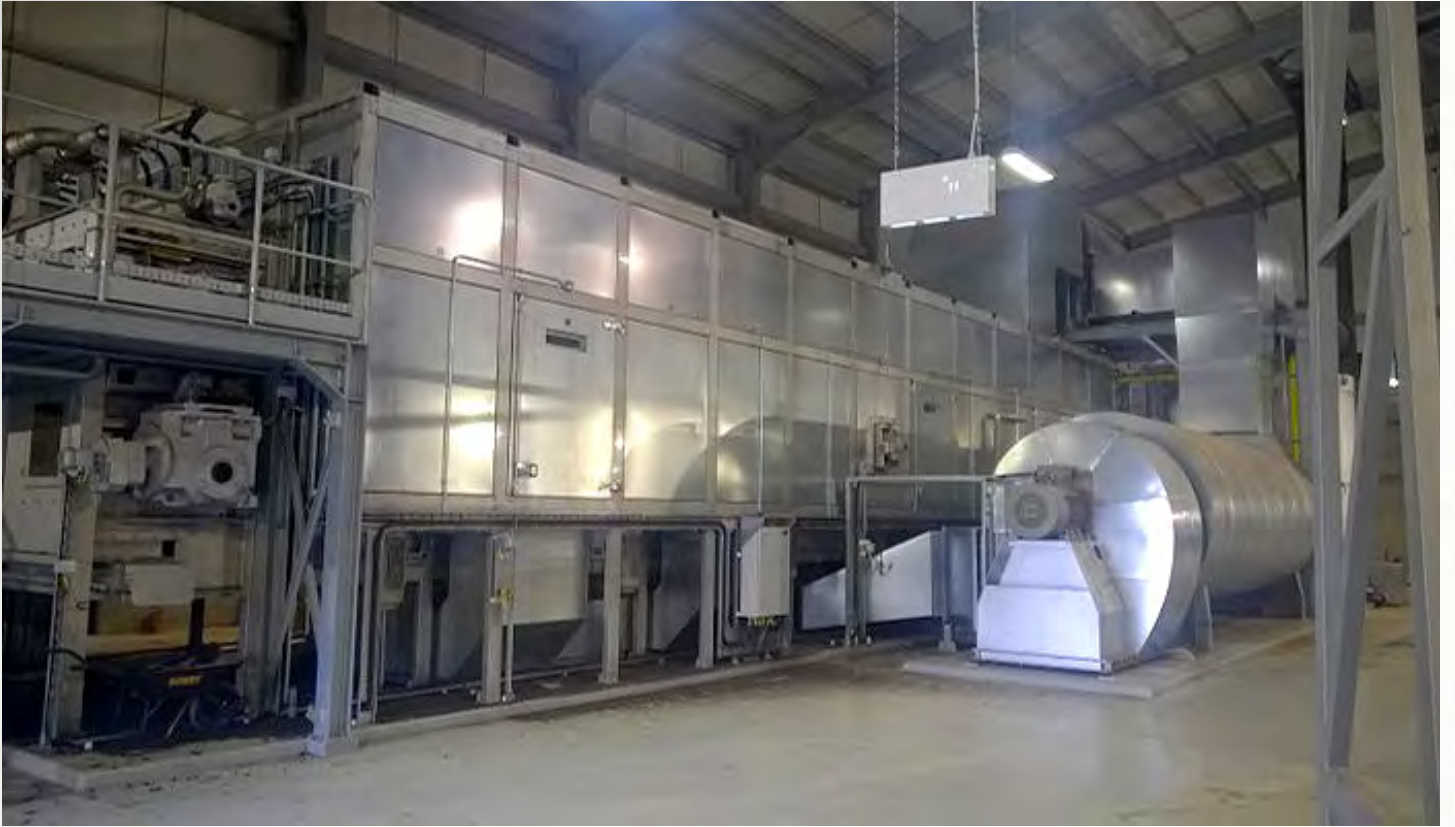
项目地: Veolia Water DB, 爱尔兰 | 型号: PBT 2/4000-18 | 安装年份: 2017 干燥物料: 市政污泥 | 蒸发量: 3.4吨/小时