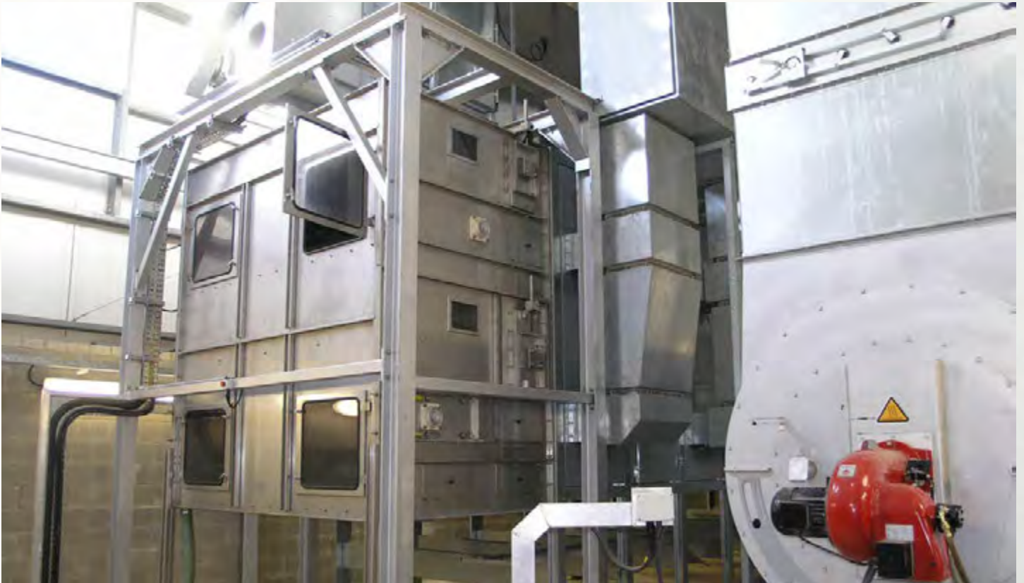
项目地：Wexford, 爱尔兰 | 型号：PBT 2/2500-12 | 安装年份：2003 干燥物料：市政污泥 | 蒸发量：1,250公斤/小时