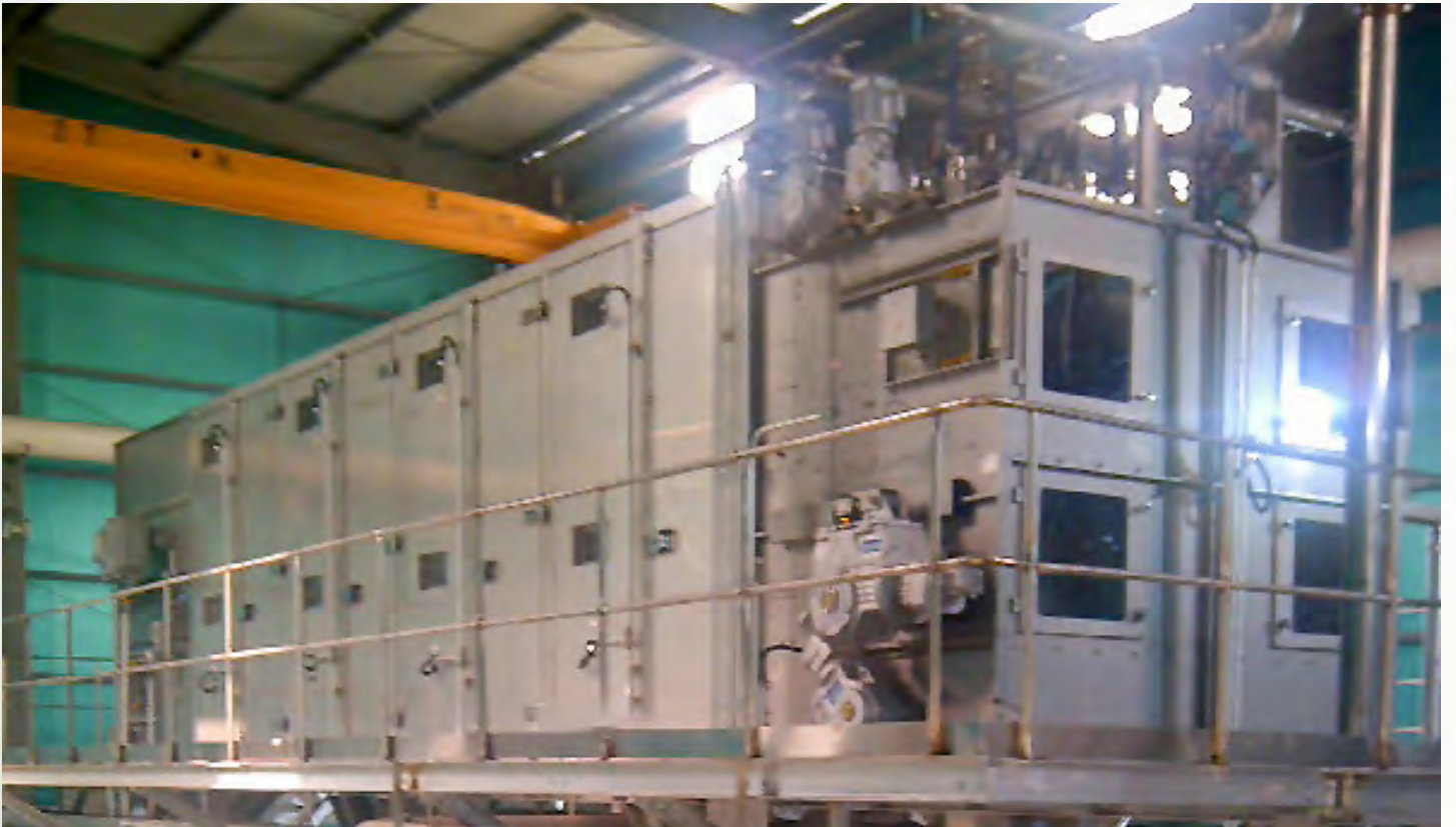
项目地: Ekosep Engineering, 中国 | 型号: PBT 2/2500-8 | 安装年份: 2015 干燥物料: 市政污泥 | 蒸发量: 694公斤/小时