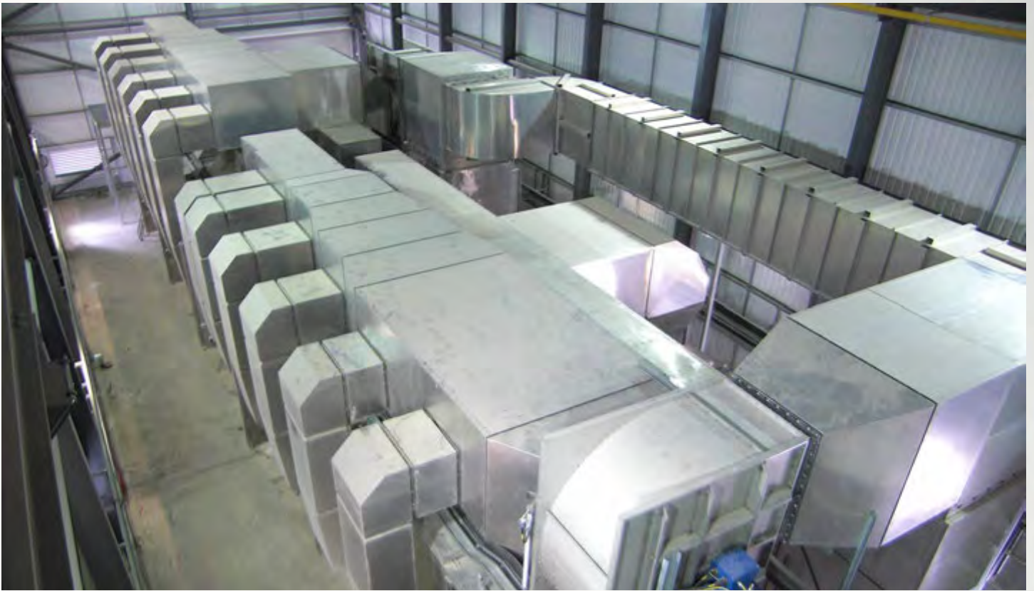
项目地：Euroby, 英格兰 | 型号：PBT 2/2500-24 | 安装年份：2008 干燥物料：市政污泥 | 蒸发量：3,000公斤/小时