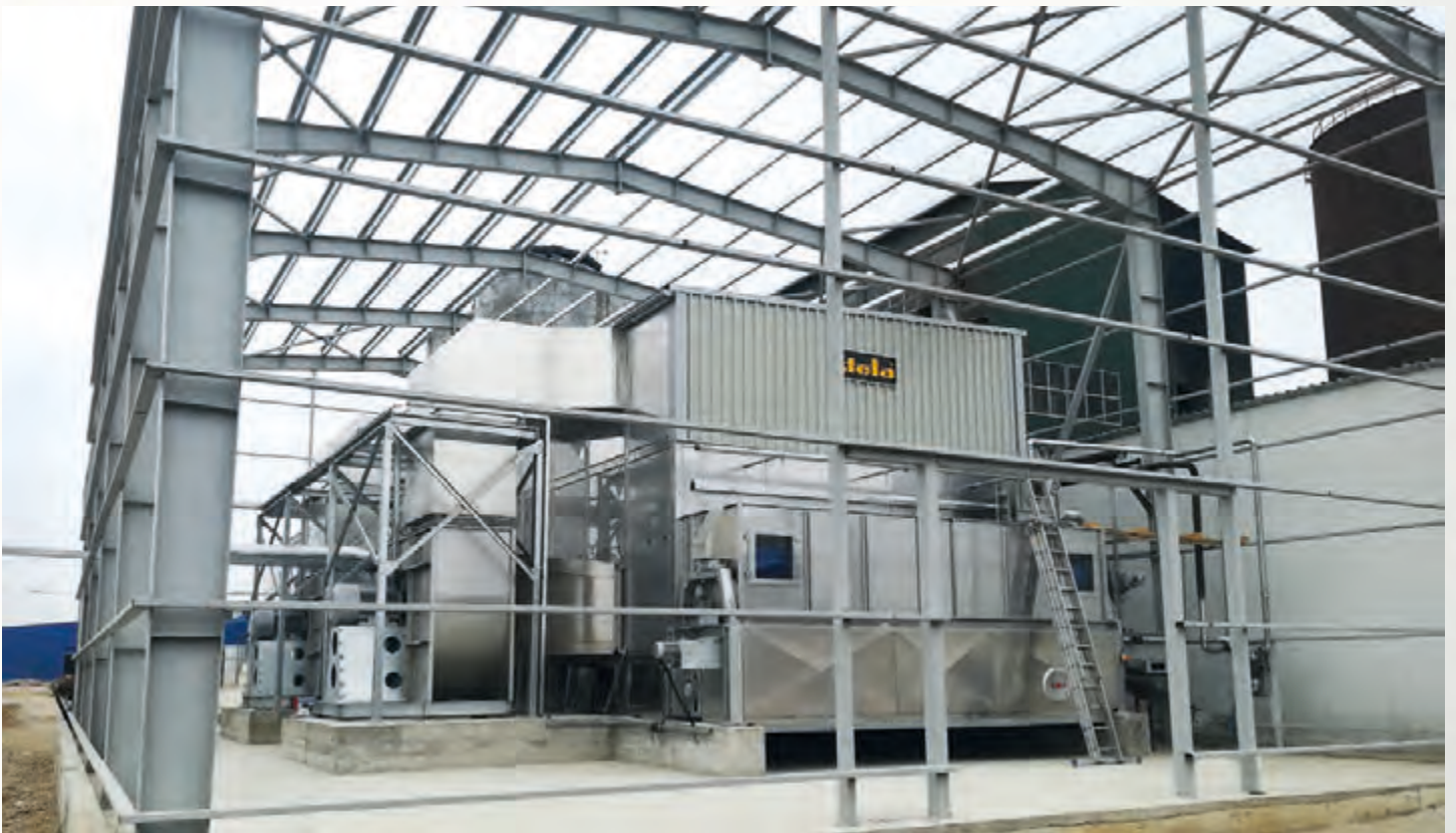
项目地: Vrancart S.A., 罗马尼亚 | 型号: BTU 1/6200-15-2/2 | 安装年份: 2018 干燥物料: 造纸污泥 | 蒸发量: 2.35吨/小时