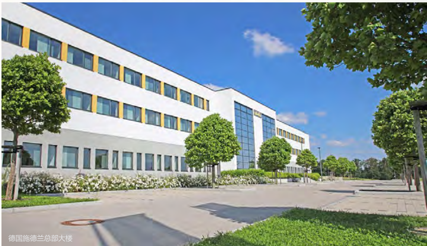
德国施德兰总部大楼