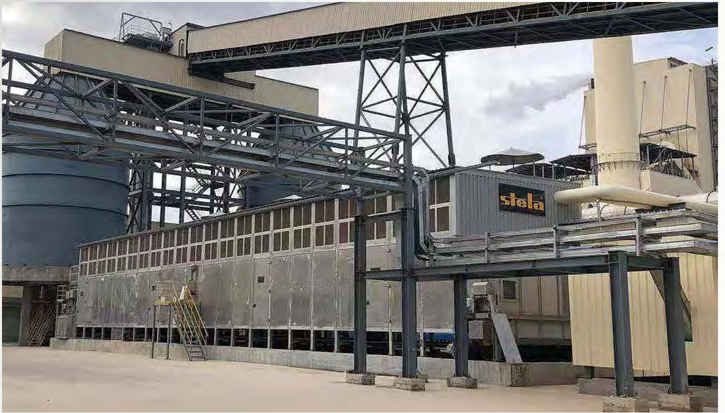
项目地：太阳纸业, 老挝 | 型号：2x BT 1/6200-33 | 安装年份：2019 干燥物料：纸污泥、木屑树皮和浆渣 | 出料能力：约2x 40.2吨/小时 | 降水区间：55% - 30%湿度