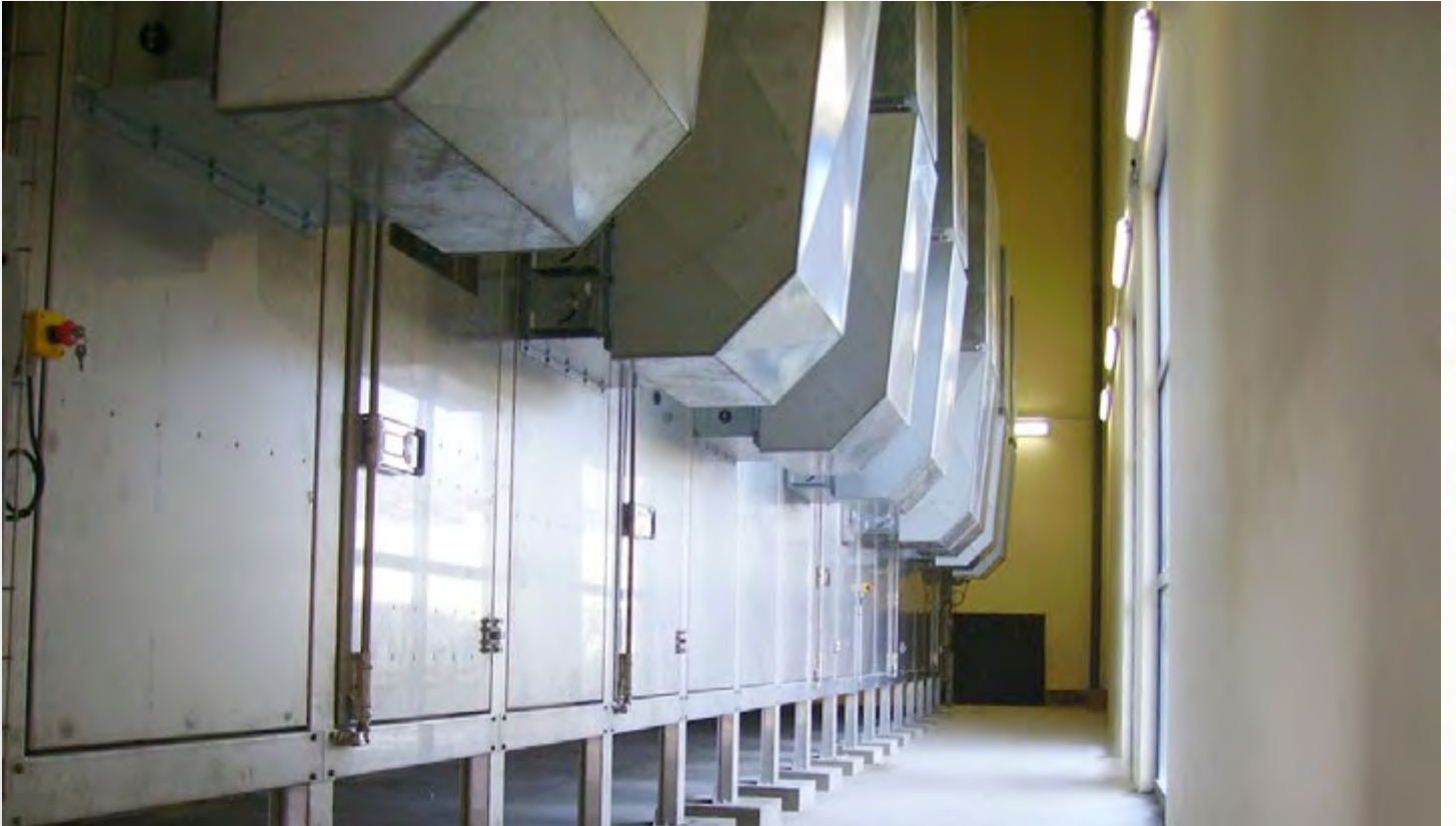
项目地：VBC 3000, 法国 | 型号：PBT 2/2500-16 | 安装年份：2008 干燥物料：市政污泥 | 蒸发量：1,556公斤/小时