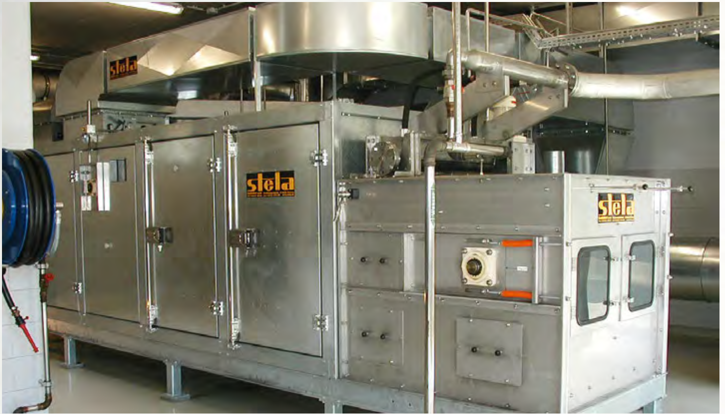
项目地：Abwasserverband Unteres Wipptal, 奥地利 | 型号：PBTk 1/1000-5 | 安装年份：2002 干燥物料：市政污泥 | 蒸发量：100公斤/小时