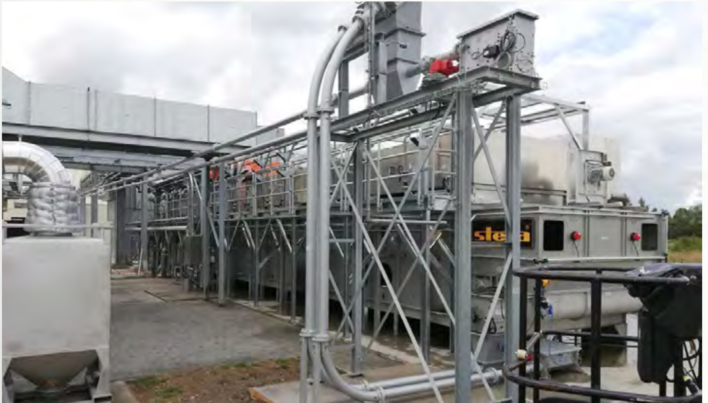
项目地：Ecoson Belgie BVBA, 比利时 | 型号：BTLU 1/3000-25 | 安装年份：2019 干燥物料：消化污泥 | 蒸发量：1.5吨/小时