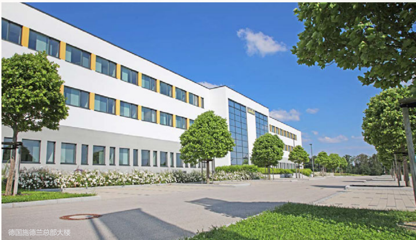
德国施德兰总部大楼