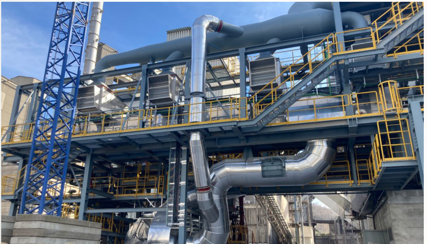
项目地：CEM Rohoznik CRH, 斯洛伐克 | 型号：BTL 1/3000-18 | 安装年份：2023 干燥物料：RDF垃圾燃料 | 出料能力：约10.0吨/小时 | 降水区间：22% - 10%湿度