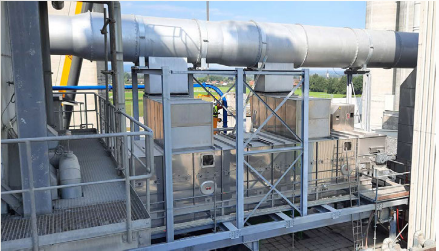
项目地：Südbayerisches Portland Zementwerk, 德国 | 型号：BTL 1/3000-20 | 安装年份：2021 干燥物料：RDF垃圾燃料 | 出料能力：约10.4吨/小时 | 降水区间：18% - 5%湿度