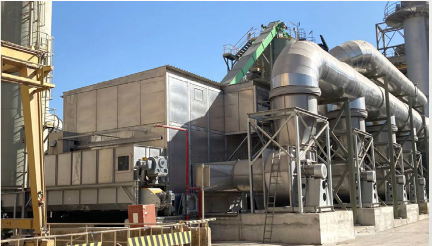
项目地：Secil水泥, 葡萄牙 | 型号：BT 1/6200-30 | 安装年份：2022 干燥物料：RDF垃圾燃料和MSW城市固废 | 出料能力：约20.0吨/小时 | 降水区间：35% - 15%湿度