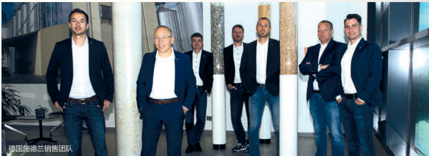
德国施德兰销售团队