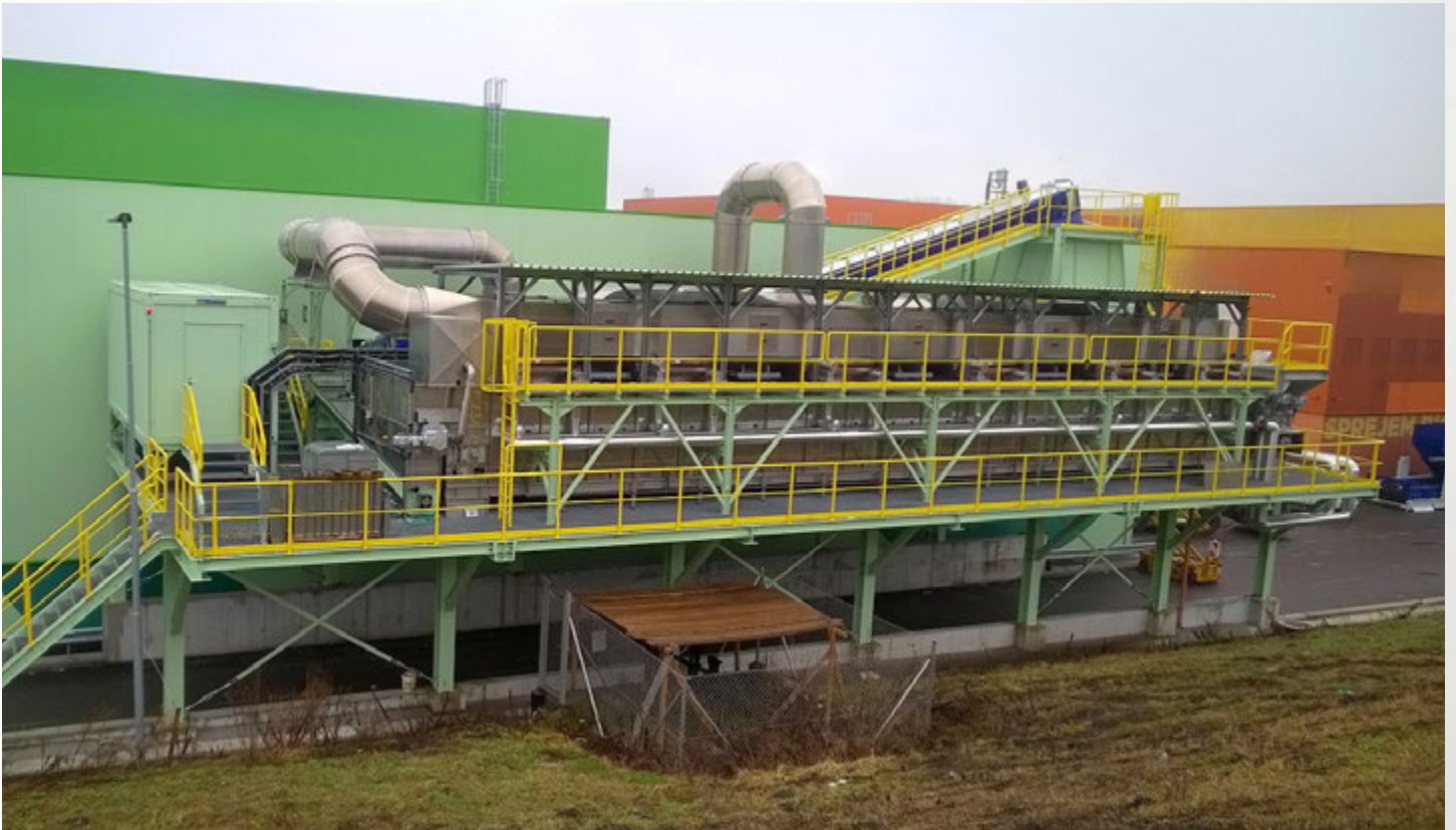
项目地：Strabag, 斯洛文尼亚 | 型号：BTLU 1/3000-54-6/5 | 安装年份：2018 干燥物料：MSW城市固废 | 出料能力：约7.0吨/小时 | 降水区间：28% - 15%湿度