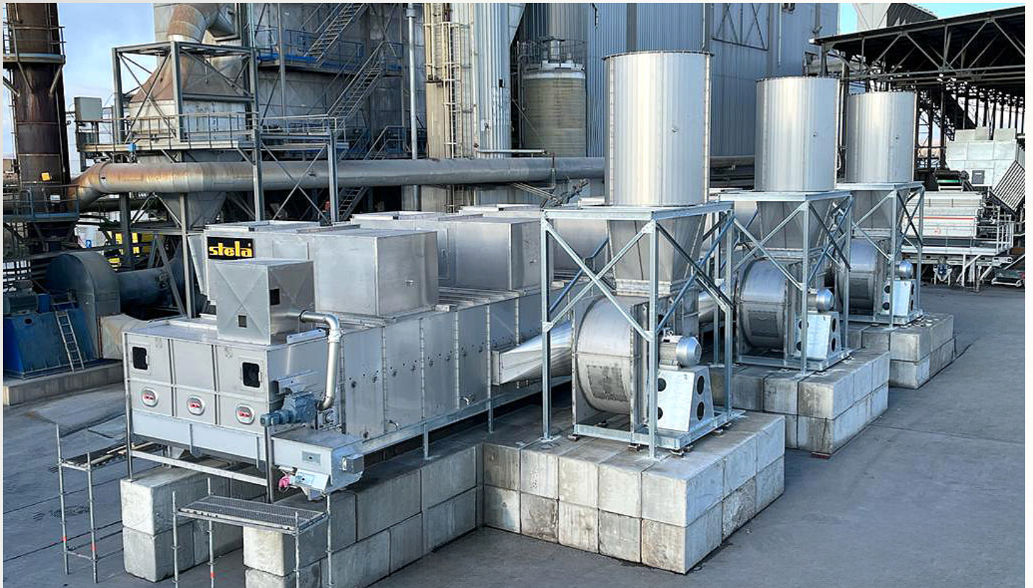
项目地: Repsan Energy SRL, 罗马尼亚 | 型号: BTL 1/3000-26 | 安装年份: 2022 干燥物料: RDF垃圾燃料和MSW城市固废 | 出料能力: 约10.8吨/小时 | 降水区间: 40% - 25%湿度