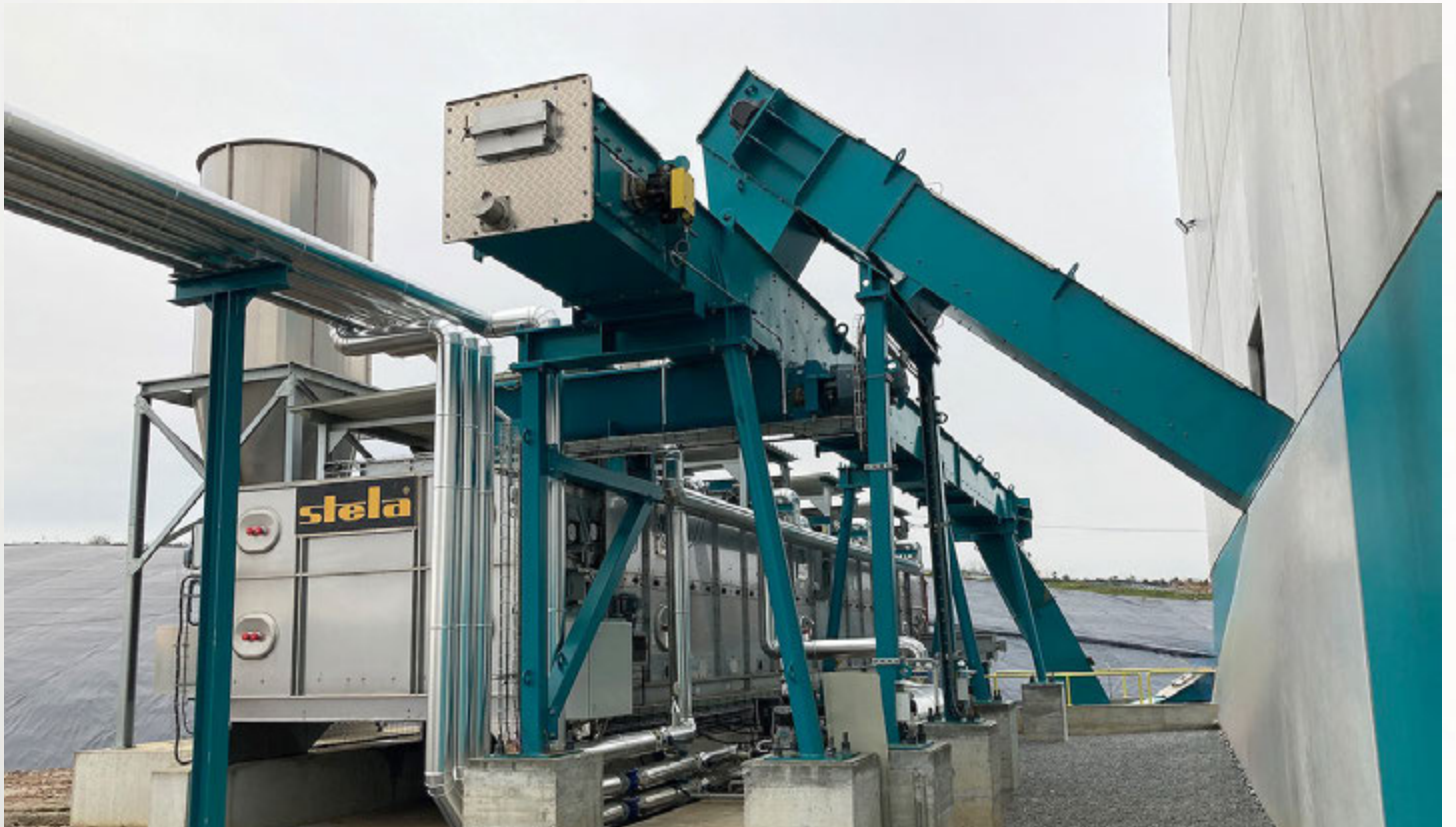
项目地: Ecobeirao, 葡萄牙 | 型号: BTL 1/3000-14 | 安装年份: 2023 干燥物料: SRF固体回收燃料 | 出料能力: 约3.0吨/小时 | 降水区间: 65% - 47%湿度