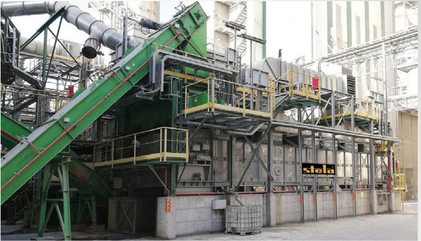
项目地：Nesher Israel 水泥, 以色列 | 型号：BTLU 1/3000-16-2/1 | 安装年份：2018 干燥物料：RDF垃圾燃料 | 蒸发量：最大1.1吨/小时