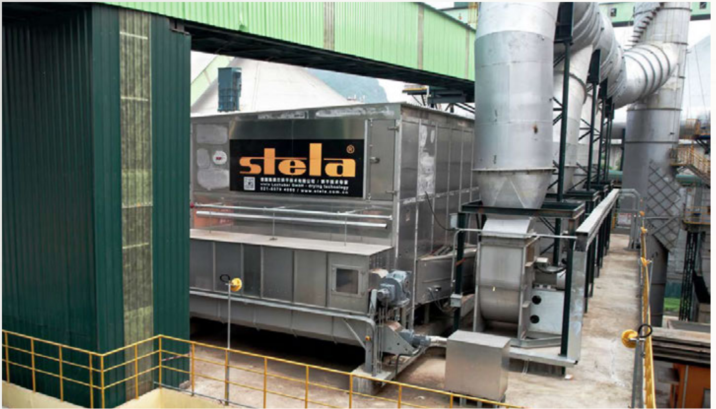
项目地：台泥贵港水泥，中国 | 型号：BT 1/6200-30 | 安装年份：2022 干燥物料：RDF垃圾燃料和树皮混料 | 出料能力：约12.4吨/小时 | 降水区间：50% - 15%湿度