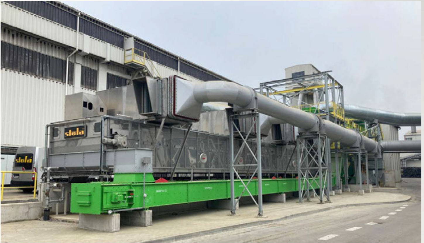
项目地：Dyckerhof Polska, 波兰 | 型号：BTL 1/3000-22 | 安装年份：2023 干燥物料：RDF垃圾燃料 | 出料能力：约23.0吨/小时 | 降水区间：19% - 10%湿度