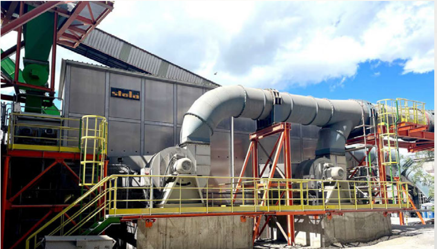
项目地：Romcim S.A., 罗马尼亚 | 型号：BT 1/6200-15 | 安装年份：2023 干燥物料：SSW固废垃圾 | 出料能力：约8.0吨/小时 | 降水区间：35% - 10%湿度