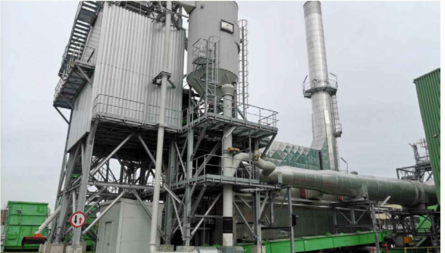
项目地：Gorazdze Cement, 波兰 | 型号：BT 1/6200-16.5 | 安装年份：2017 干燥物料：RDF垃圾燃料和MSW城市固废 | 出料能力：约20.0吨/小时 | 降水区间：35% - 20%湿度