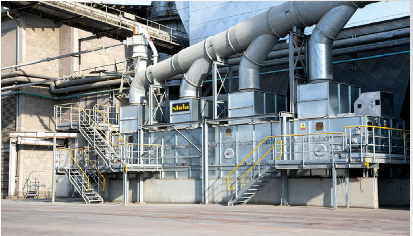
项目地：南德水泥, 德国 | 型号：BTL 1/3000-14 | 安装年份：2017 干燥物料：RDF垃圾燃料 | 蒸发量：最大1.1吨/小时