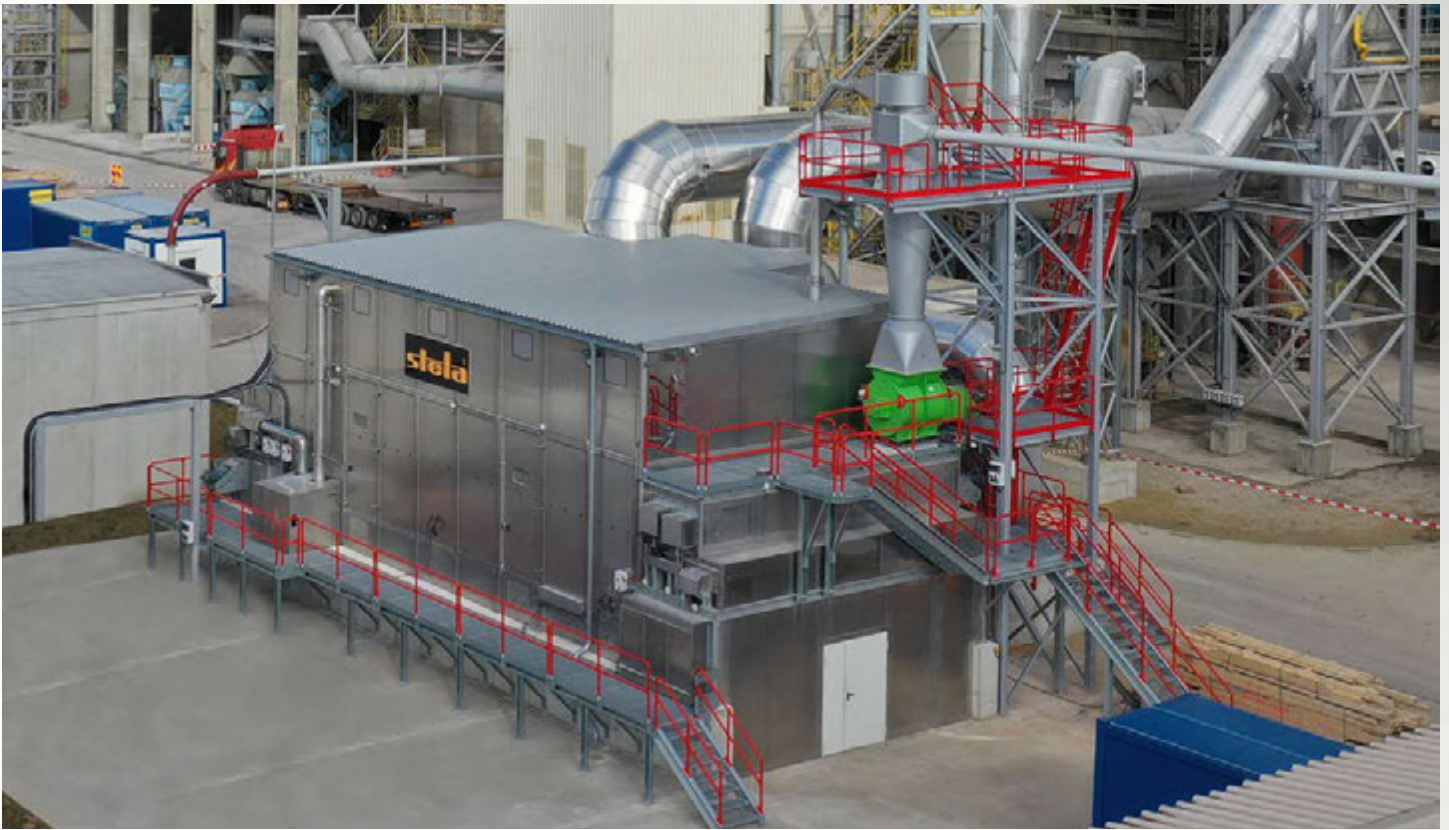
项目地：Schwenk, 拉脱维亚 | 型号：BT 1/6200-13.5 | 安装年份：2021 干燥物料：RDF垃圾燃料 | 出料能力：约7.7吨/小时 | 降水区间：25% - 3%湿度