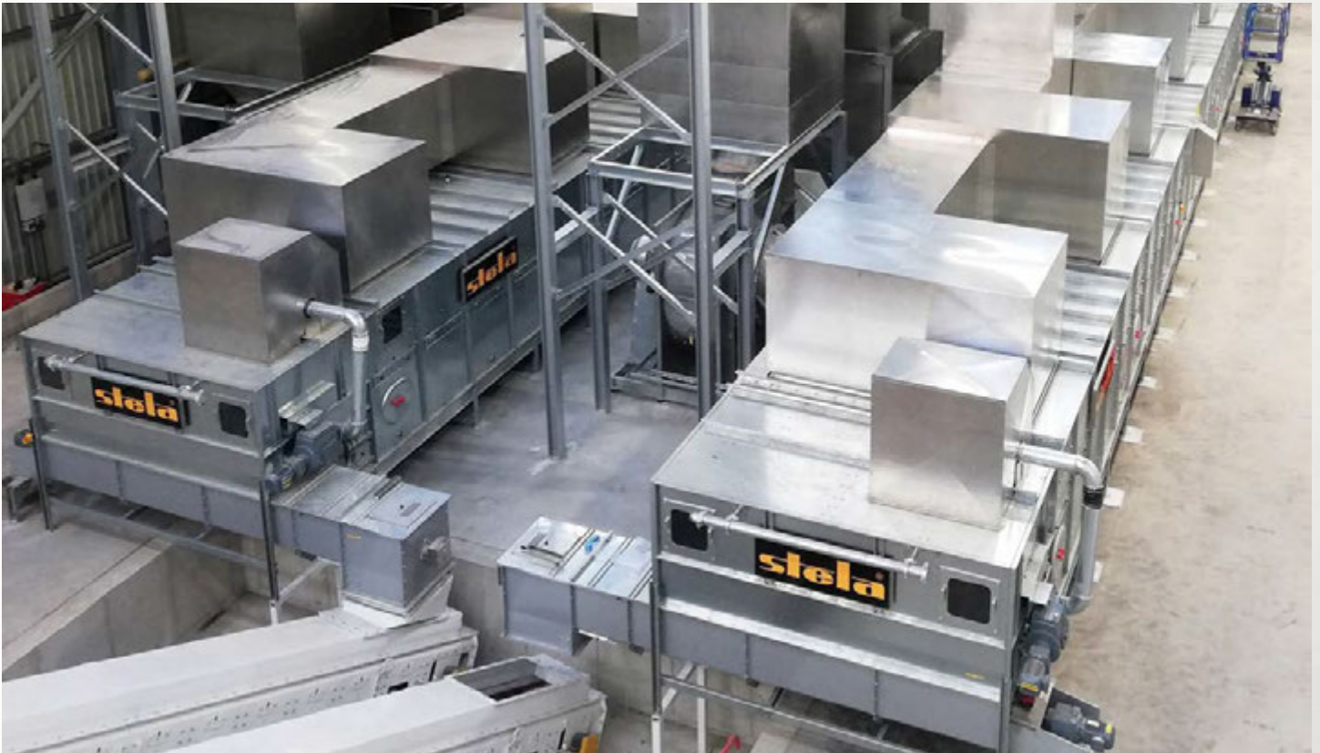
项目地：AV Dawson, 英国 | 型号：2x BTL 1/3000-22 | 安装年份：2021 干燥物料：SRF固体回收燃料 | 出料能力：约36.0吨/小时 | 降水区间：20% - 10%湿度