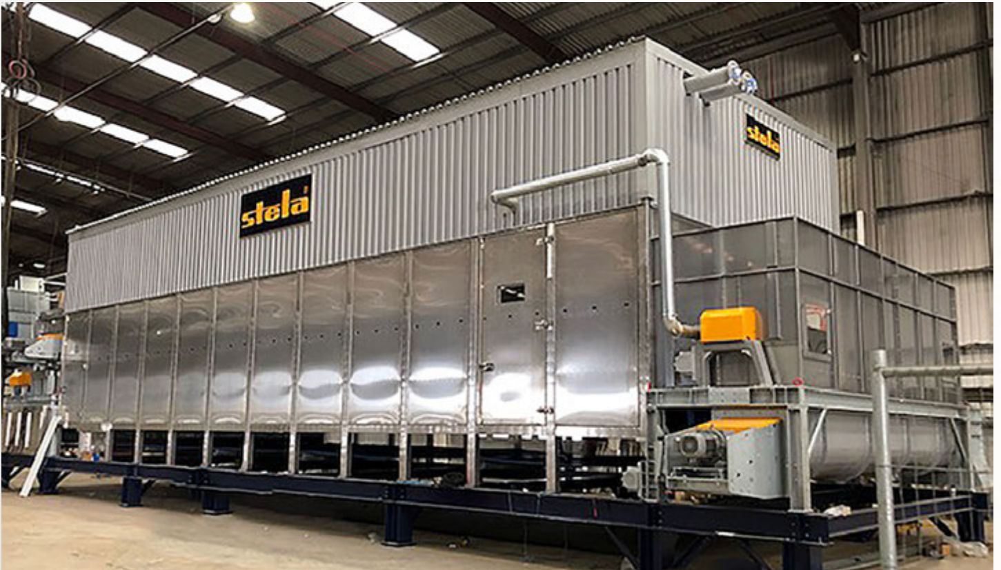
项目地：Subcoal Production, 英国 | 型号：BT 1/6200-18 | 安装年份：2019 干燥物料：RDF垃圾燃料 | 出料能力：约19.0吨/小时 | 降水区间：25% - 10%湿度