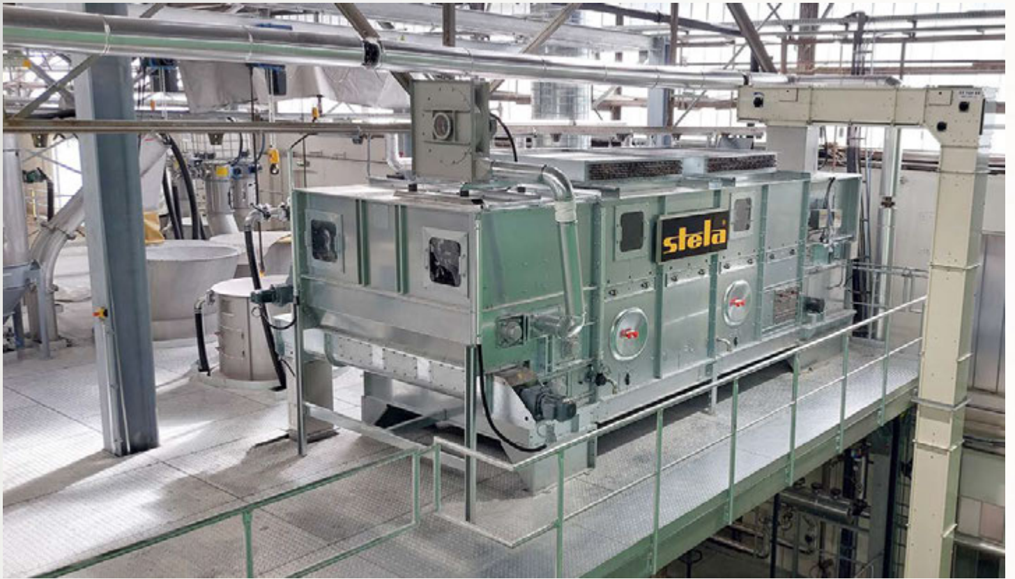
项目地: Akdeniz Chemson, 葡萄牙 | 型号: BTL 1/2000-4 | 安装年份: 2023 干燥物料: 颗粒塑料 | 出料能力: 约2.27吨/小时 | 降水区间: 10% - <1%湿度