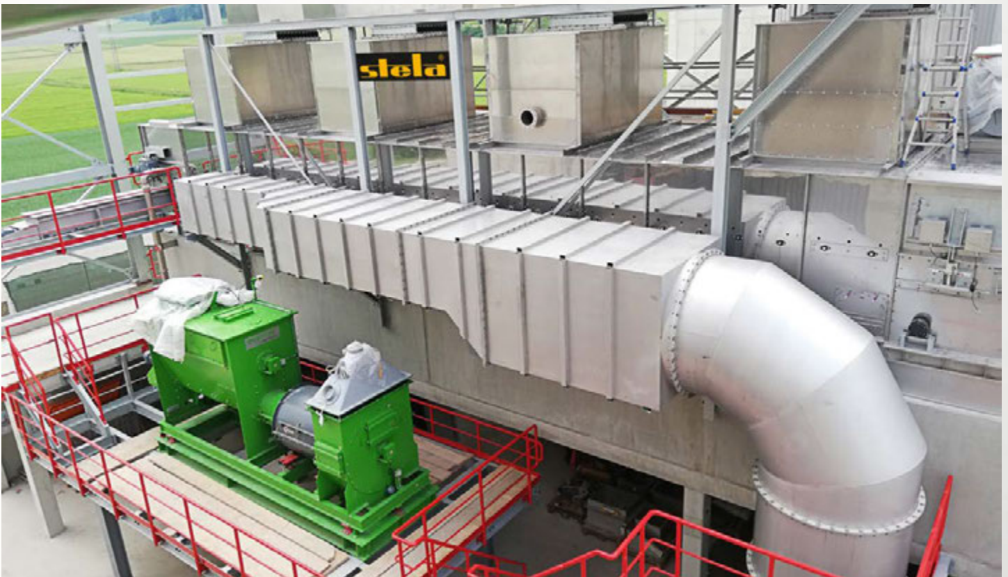
项目地：Schwenk 水泥, 德国 | 型号：BTL 1/3000-14 | 安装年份：2022 干燥物料：RDF垃圾燃料 | 出料能力：约9.0吨/小时 | 降水区间：15% - 5%湿度