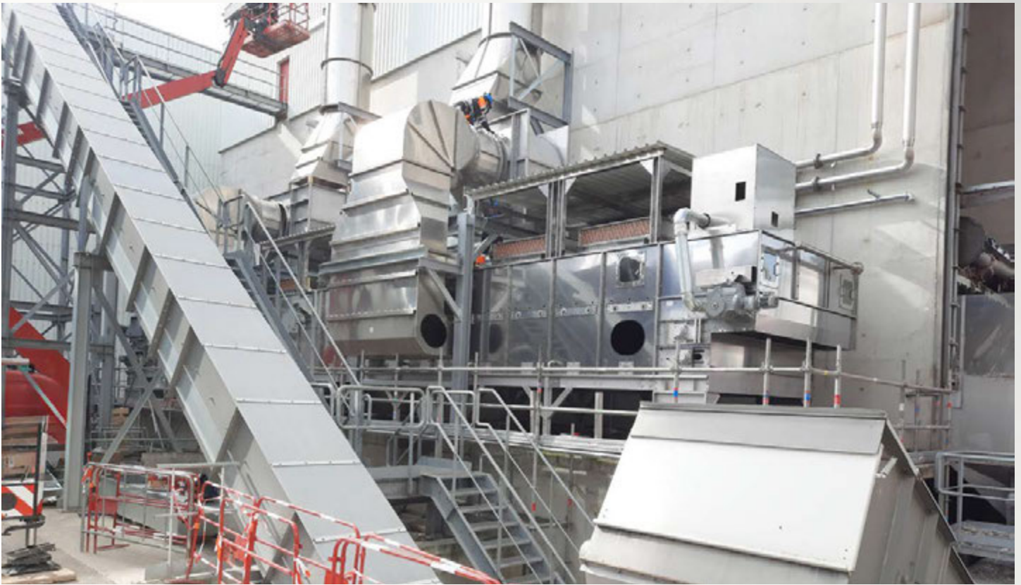
项目地：Blue Paper, 法国 | 型号：BTL 1/3000-20 | 安装年份：2023 干燥物料：Rejects垃圾燃料（塑料和纤维） | 出料能力：约3.0吨/小时 | 降水区间：45% - 8-10%湿度