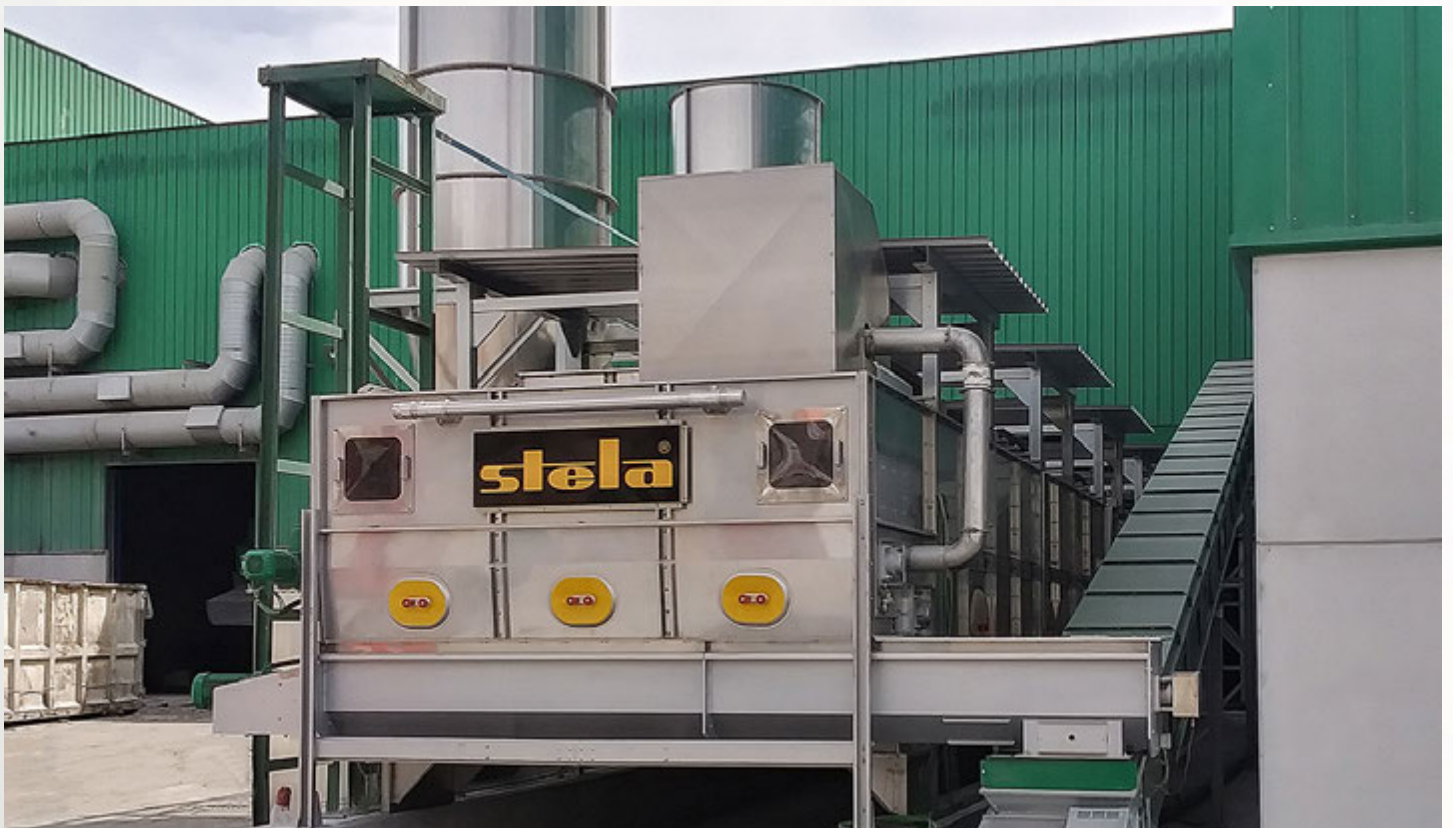
项目地: FCC Centro de tratamiento de residuos las marinas, 西班牙 | 型号: BTL 1/3000-18 | 安装年份: 2021 干燥物料: CDR垃圾燃料 | 出料能力: 约3.7吨/小时 | 降水区间: 42.5% - 15%湿度