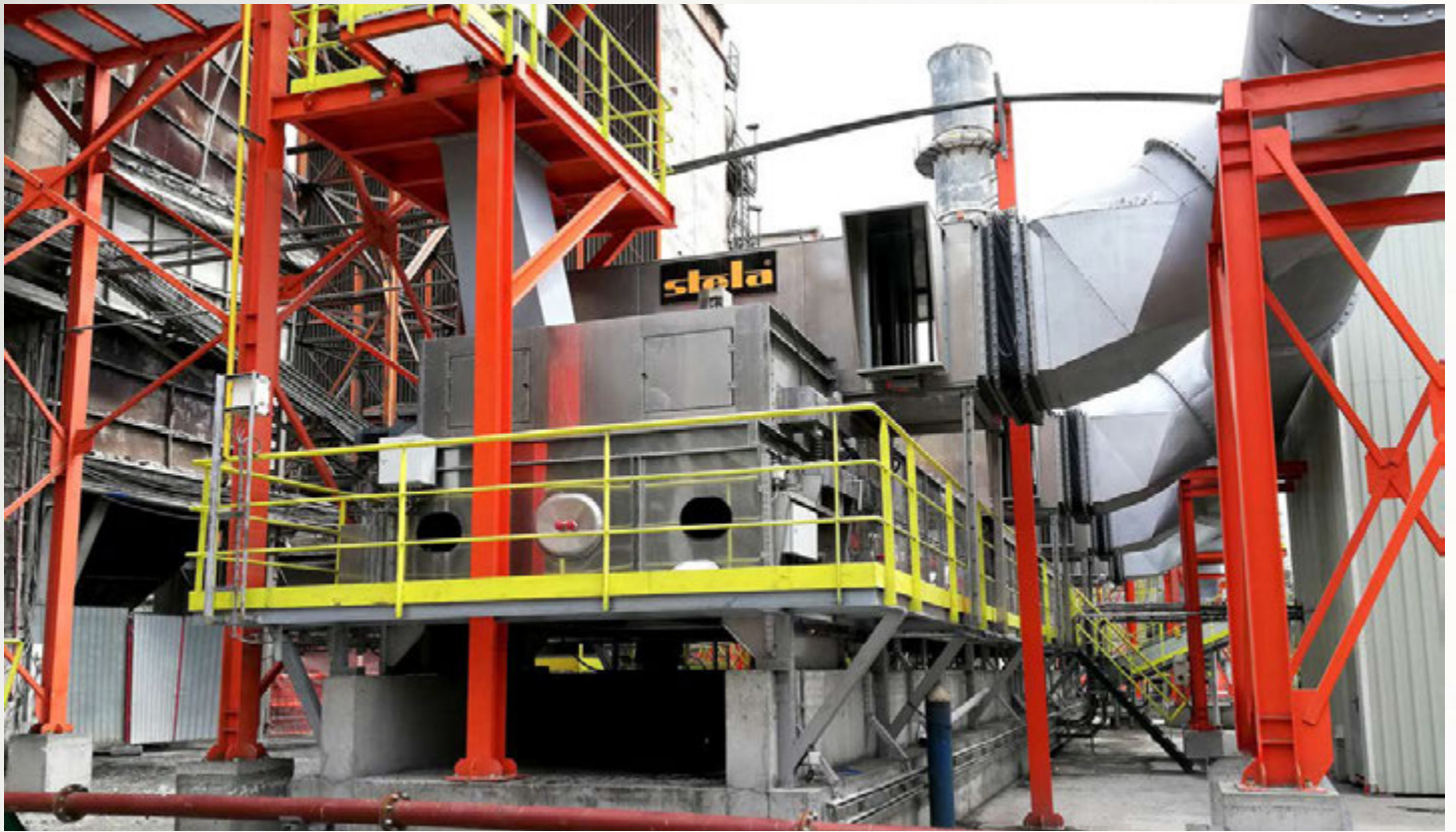
项目地：CRH Romania, 罗马尼亚 | 型号：BTL 1/3000-25 | 安装年份：2019 干燥物料：SSW固废垃圾 | 蒸发量：最大3.3吨/小时