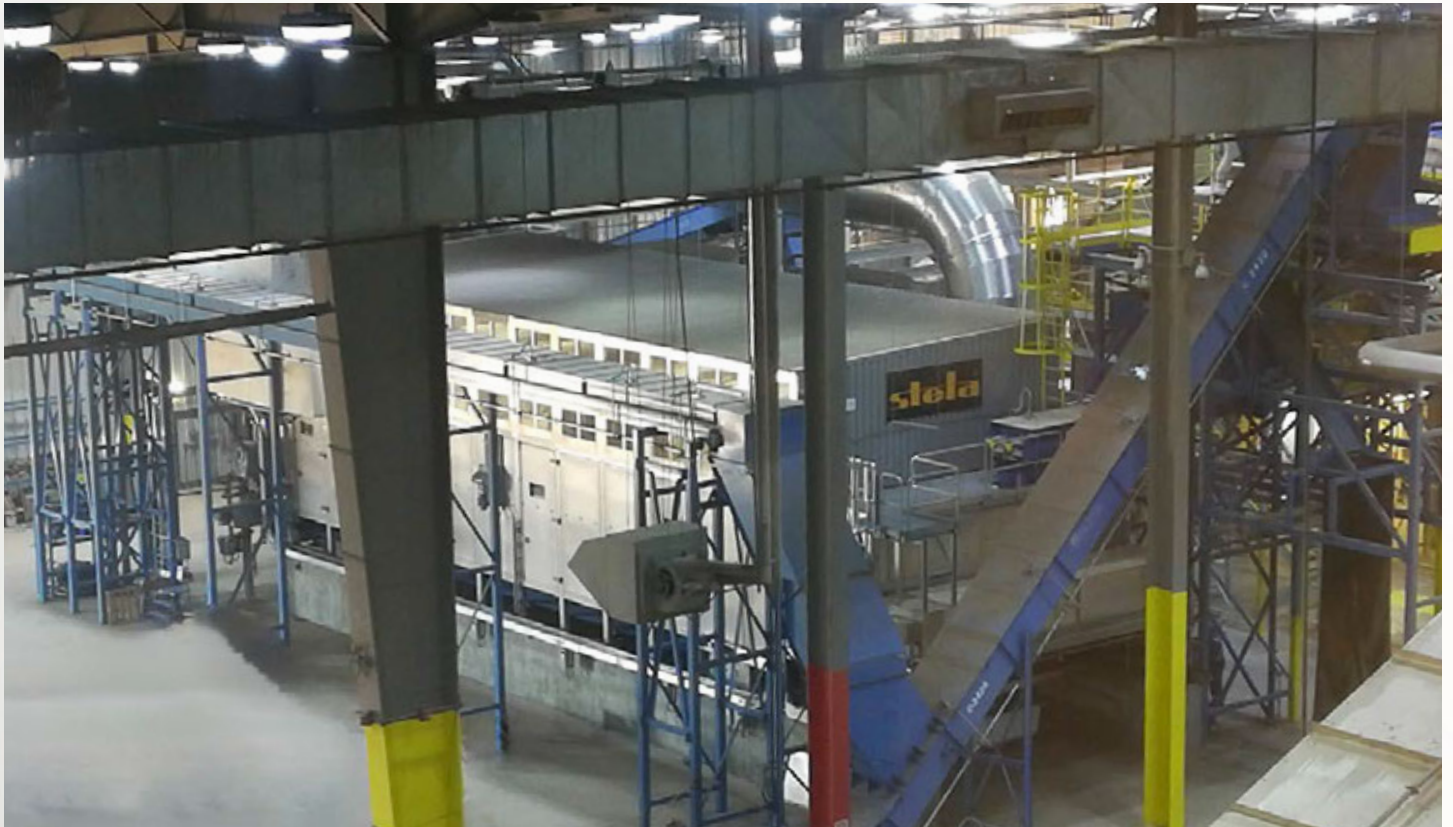
项目地：Edmonton Cement, 加拿大 | 型号：BTU 1/6200-18-3/2 | 安装年份：2018 干燥物料：RDF垃圾燃料 | 出料能力：约3.0吨/小时 | 降水区间：50% - 10%湿度