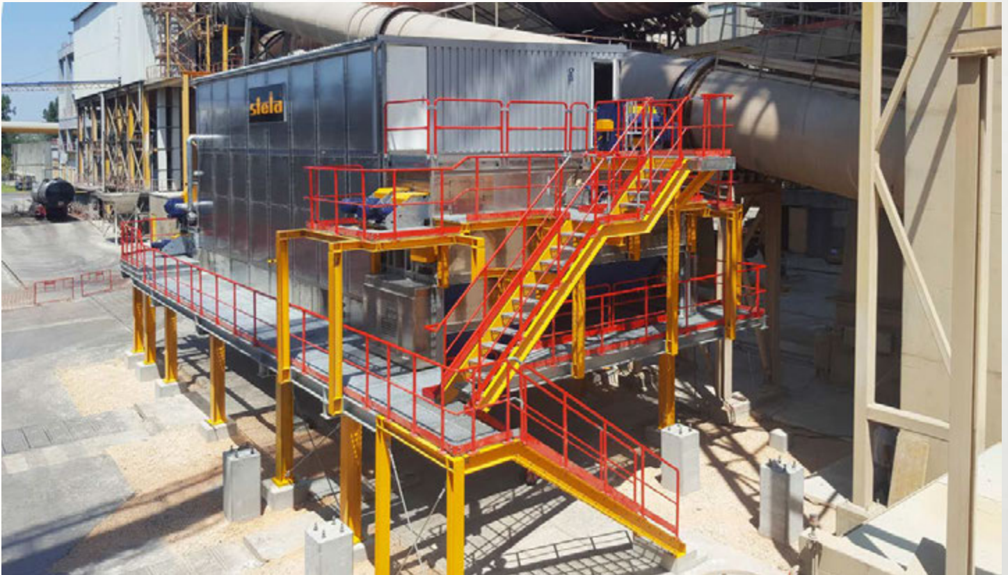
项目地：Cimpor, 葡萄牙 | 型号：BT 1/6200-12 | 安装年份：2016 干燥物料：RDF垃圾燃料 | 出料能力：约7.0吨/小时 | 降水区间：40% - 15%湿度