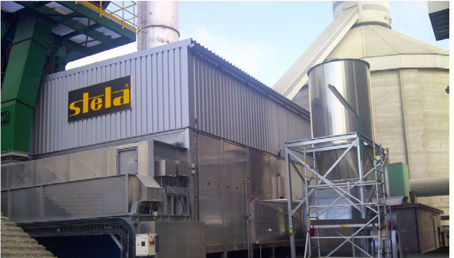
项目地：Lafarge, 波兰 | 型号：BT 1/2700-10 | 安装年份：2014 干燥物料：SSW固废垃圾 | 出料能力：约10.0吨/小时 | 降水区间：35% - 10%湿度