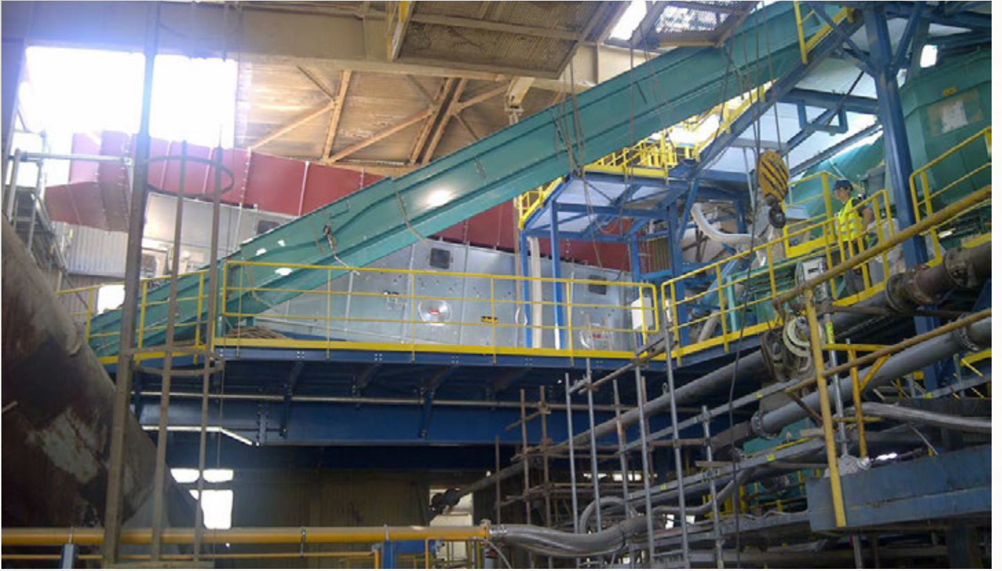
项目地：Lafarge, 捷克 | 型号：BTL 1/3000-8 | 安装年份：2014 干燥物料：SSW固废垃圾 | 出料能力：约5.7吨/小时 | 降水区间：26% - 10%湿度