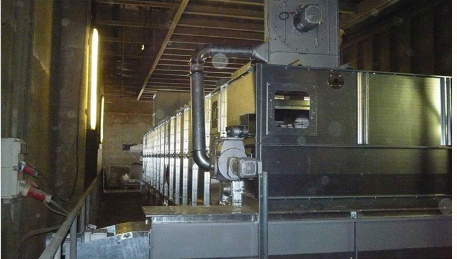
项目地：东德水泥, 德国 | 型号：BTL 1/3000-14 | 安装年份：2017 干燥物料：RDF垃圾燃料 | 蒸发量：最大1.1吨/小时